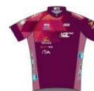
SPRINTEUR CLUB FEMININ