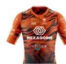
HEXAGONE COBAS LYON METROPOLE